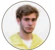
PORNOPRATEN 5 OM PORNO side 14 til 17